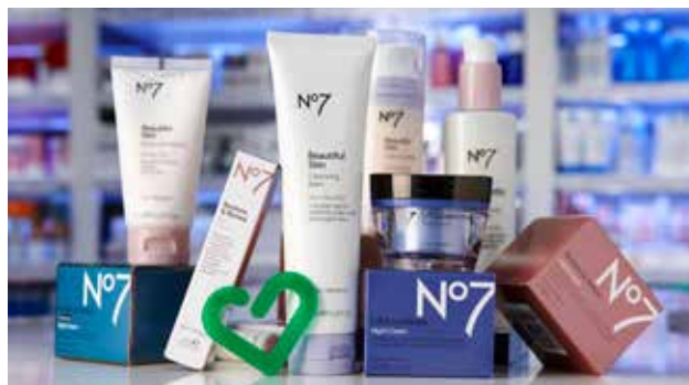
Boots storsäljare till Apotek Hjärtat.

Ett nytt eget premiumvarumärke introduceras under 2013. Det är en serie apoteksprodukter för kunders välbefinnande med hög kvalitet och konkurrenskraftigt pris. Ett exklusivt samarbete har inletts med Boots, världens största apoteksgrupp. Boots kända varumärken No7 och Botanics kommer att säljas på Apotek Hjärtat från och med april 2013.